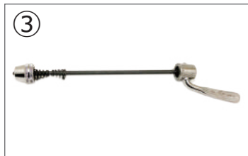
③クイックリリース