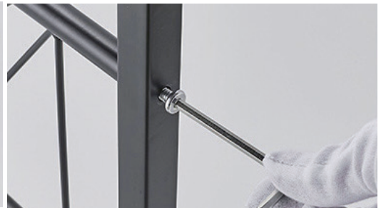
②BとCをねじで取り付け。