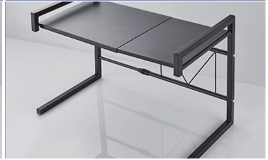
④Dを上部に設置して完成。