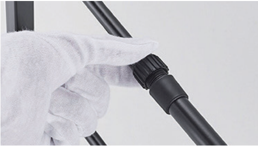
①AをBの先端に入れて、時計回り回してロック。